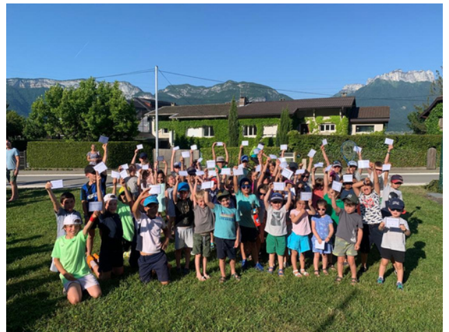
Remise des niveaux