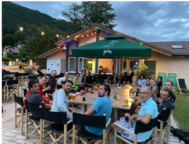
Soirée des entrainements