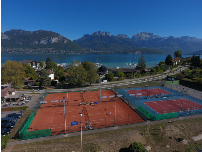
26 Route du Port 74320 Sévrier