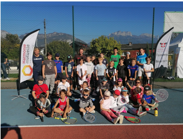
Fête de l'école de Tennis