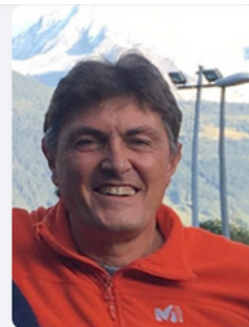
Joël Lemaitre Infrastructures