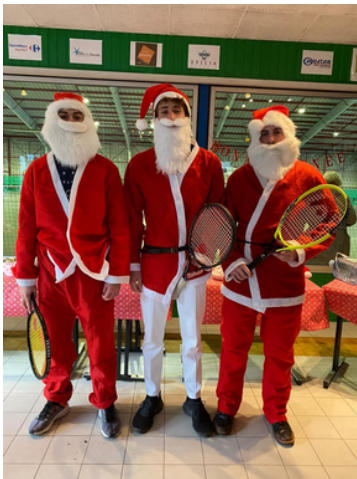
Fête de Noël