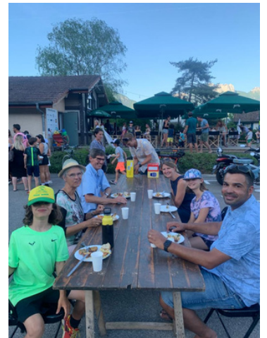
Barbecue de fin d'année