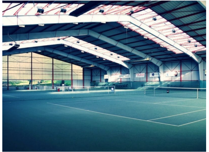
5 Route du Piron 74320 Sévrier

Le TC Sévrier est un club pour tous, et vous propose différents types d'activité :